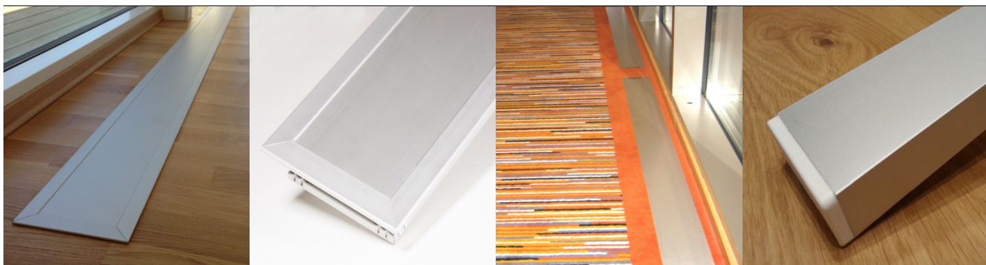
E-100 med ramme nedfelt i parkett

Varmelist uten ramme festes til underlaget med tilhørende festebreketter eller borrelås, evt. felles ned på lik linje med varmelist med ramme, men det kreves da større presisjon når utsparringen lages.