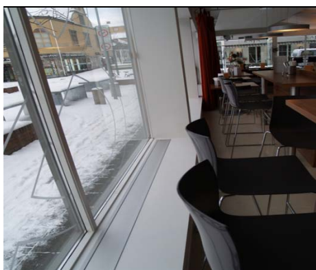
E-050 med ramme nedfelt i vinduskarm

Varmelist uten ramme festes til underlaget med tilhørende festebraketter eller borrelås, evt. felles ned på lik linje med varmelist med ramme, men det kreves da større presisjon når utsparringen lages.