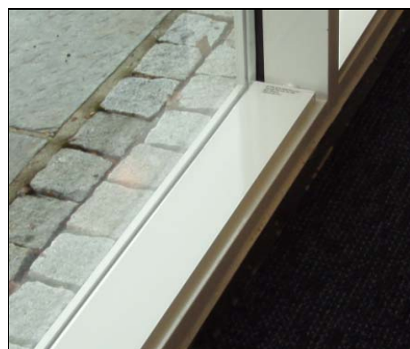
E-050 uten ramme i vinduskarm