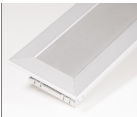
E-050 med ramme