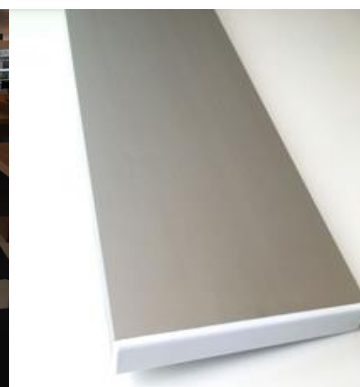
E-200 uten ramme