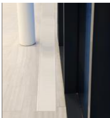
E-200 med ramme nedfelt i marmorfliser

Varmelist uten ramme festes til underlaget med tilhørende festebraketter eller borrelås, evt. felles ned på lik linje med varmelist med ramme, men det kreves da større presisjon når utsparringen lages.