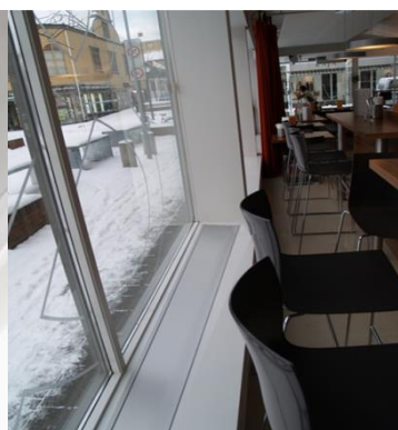
E-200 med ramme nedfelt i vinduskarm