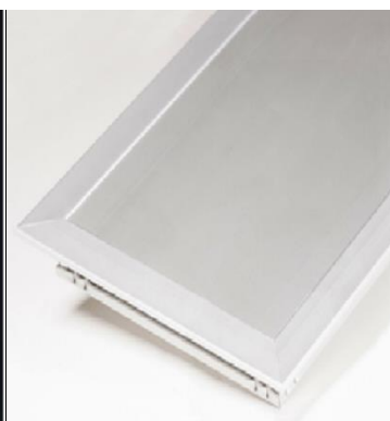
E-200 med ramme